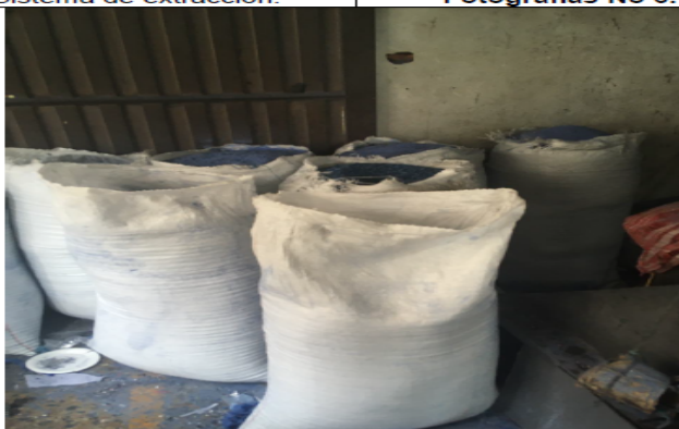
Fotografías No 7. Producto final.