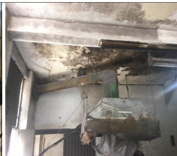
Fotografías No 3 y 4. Aglutinadora y campana de extracción.