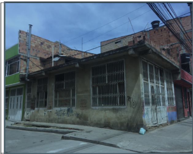
Fotografía No 1. Fachada del predio.