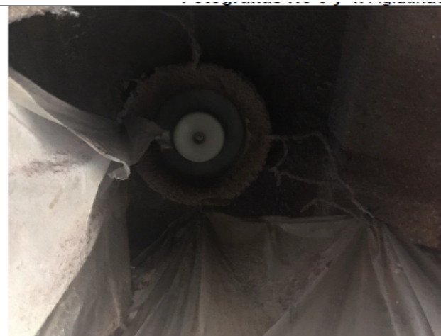
Fotografías No 5. Sistema de extracción.