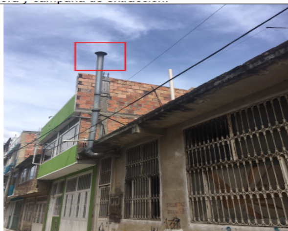
Fotografías No 6. Ducto de descarga.