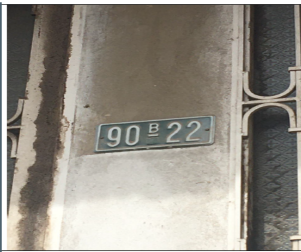
Fotografía No 2. Nomenclatura urbana.